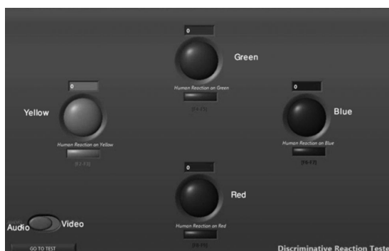
شکل 2- تصویر چهار دایره ی رنگی برای تست های زمان عکس‌العمل بینایی و شنوایی

چنانچه در منوی اولیه آزمونگر آزمون زمان عکس‌العمل را انتخاب می‌نمود، نرم افزار پنجره تست زمان عکس‌العمل را باز می‌کرد. در این بخش امکان ایجاد تحریک بینایی توسط روشن