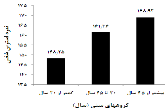
نمودار ۲: توزیع استرس شغلی در گروههای سنی مختلف (P=۰/۵۸)