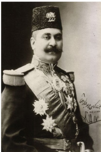
تصویری از صمدخان ممتازالسلطنه

۳- اعلان رسمی در باب قدغن بودن استعمال گلوله‌هایی که در بدن انسان به آسانی متلاشی و پهن می‌شود و کذالك گلوله‌هایی که لفافه اش ضخیم است... این قرارنامه‌ها و اعلانات رسمیه را بعد از غوررسی و تحقیق و تدقیق، قبول و ممضی داشتیم. چنان که به موجب این سطور آنها را تماماً ممضی و مجری می‌دانم و از طرف خودمان و ولیعهد و خلف خودمان قول می‌دهم که تمام فصول و مضامین این قرارنامه‌ها و اعلانات رسمیه بدون تخلف مجری خواهد شود به موجب این قبولی به دستخط خودمان این نوشته را امضا نموده و بنویسیم به مهر دولتی ممهور شود.