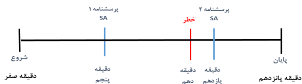
شکل ۲- مراحل انجام آزمایش

شبیه‌ساز رانندگی اتوبوس آکیا BI 301 Full توسط دانشگاه خواجه‌نصیر ساخته شده است برای ارزیابی عملکرد رانندگان استفاده شد (شکل ۳).