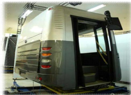
شکل ۳- شبیه‌ساز رانندگی اتوبوس آکیا BI 301 Full