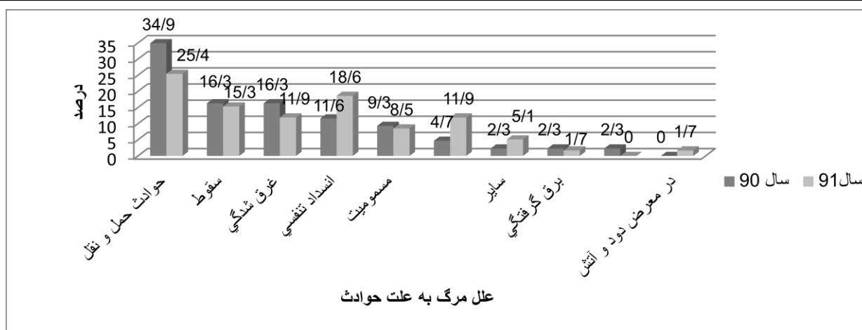
نمودار ۲. درصد فراوانی علل مرگ در کودکان ۱ تا ۵۹ ماهه به علت حوادث و سوانح در محدوده زیر پوشش دانشگاه علوم پزشکی شهید بهشتی سال ۱۳۹۰-۱۳۹۱