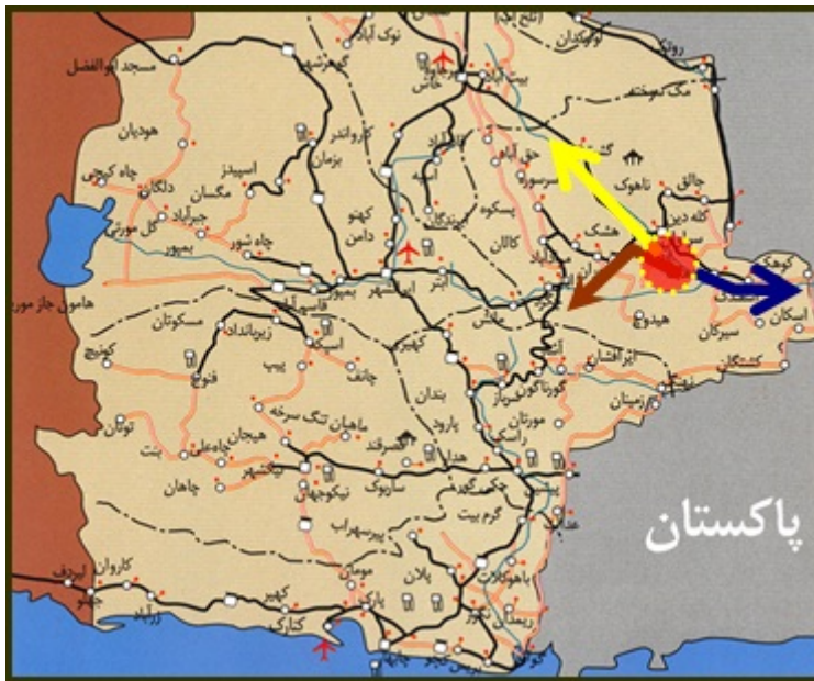
شکل (۲) نمایی از محورهای اصلی منطقه نمونه گردشگری کلپورگان با نواحی پیرامونی