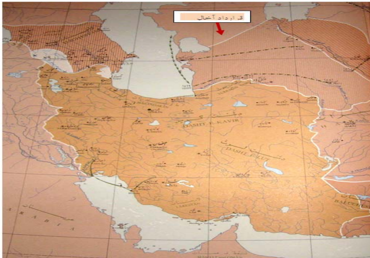
شکل (۱) نقشه سرزمین‌های جدا شده از ایران طبق قرارداد آخال (آخال - تکه)

پیمان آخال تأثیر دوگانه‌ای بر ایران داشت. از یک سو ایران تا حدی از یورش‌های ترکمن‌ها رهایی می‌یافت اما این امر به بهای گران از دست رفتن سرزمین‌هایی به‌دست آمد که ناصرالدین‌شاه ادعای سلطنت بر آن‌ها داشت (میرحیدر، ۱۳۵۶: ص ۱۸۵). این پیمان همچنین به ضرر ایلات و عشایر ترکمن‌ها بود و با مصالح سنتی قوم ترکمن هم‌خوانی نداشت. میان آنان مرز کشی شده و در دو کشور جداگانه قرار می‌گرفتند و اتحاد آنان به هم می‌خورد. یموت‌های ایران که بر اساس موافقت‌نامه دو دولت هر سال برای چراندن گله‌های خود به آن سوی مرز کوچ می‌کردند باید به هر دو دولت مالیات می‌دادند و این موضوع مقامات روسی و ایرانی را در جمع‌آوری مالیات دچار مشکل کرده بود.