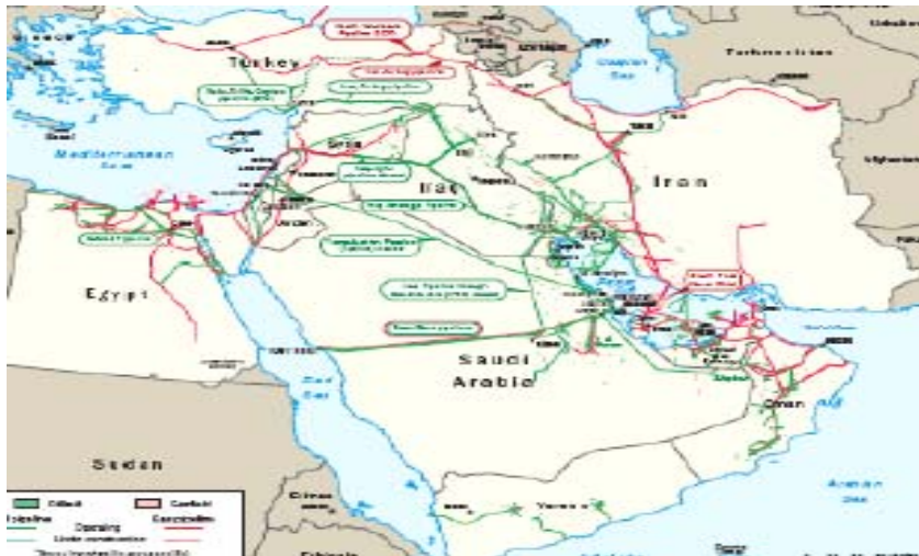
شکل (۲) نقشه خطوط لوله نفت و گاز در خلیج فارس

یکی از مناسب ترین و اقتصادی ترین روش های انتقال گاز طبیعی در حال حاضر، انتقال بوسیله خط لوله می باشد که هم اکنون قسمت اعظم انتقال گاز جهان از این طریق صورت می گیرد. بطوری که در پایان سال ۲۰۱۰ از مجموع ۹۷۵/۲۲ میلیارد متر مکعب گاز مبادله شده، ۶۷۹/۵۹ میلیارد متر مکعب آن از طریق خط لوله بوده است (Bp Statistical Review of World Energy, ۲۰۱۱: ۲۸). در منطقه خلیج فارس نیز هرچند که هم اکنون خطوط لوله گازی بین مرزی، به ندرت وجود دارد اما قراردادهای عمده ای بین کشورهای منطقه جهت انتقال گاز از طریق خط لوله بسته شده است که بعضی از آنها اجرایی شده اند. (شکل ۲)