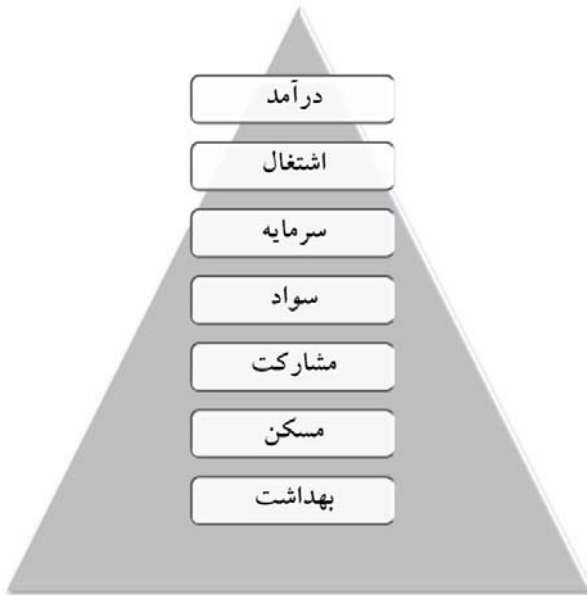
شکل (۳) هرم نیازهای اساسی توسعه روستایی در دهستان شوسف شهرستان نهبندان