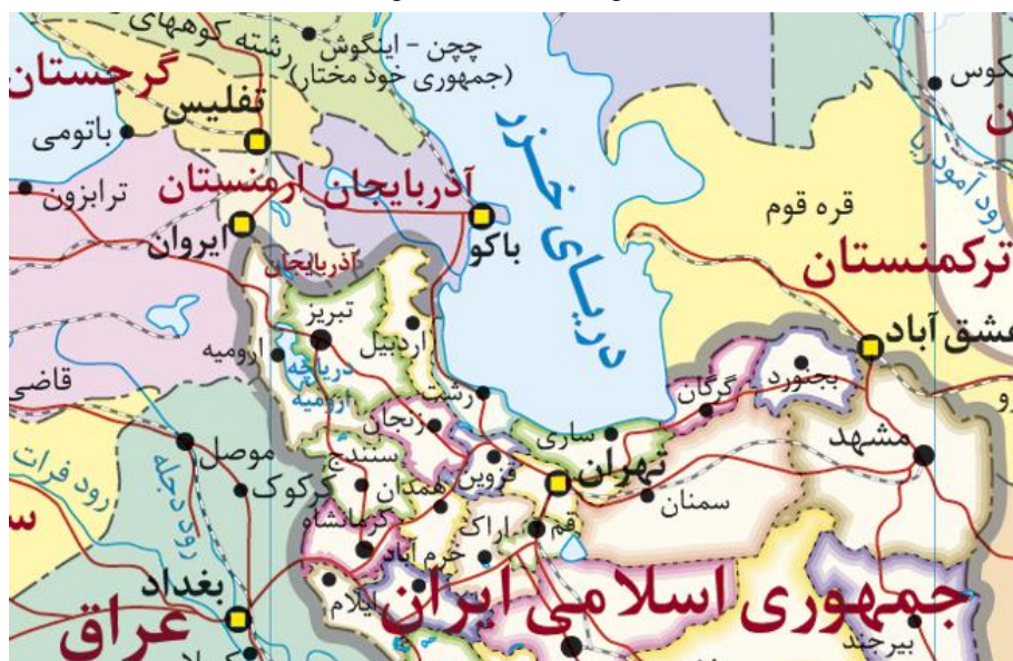
نقشه شماره ۱. نواحی مرزی جمهوری اسلامی ایران و آذربایجان

روز ۱۴ آذر ۱۳۴۹ هجری شمسی، پیرو عقد قرارداد تعیین انتظامات مرزی و تثبیت مرز جدید بین ایران و اتحاد جماهیر شوروی، اسناد علامت‌گذاری خطوط مرزی در دریاچه‌های پشت سد مخزنی ارس و سد انحرافی میل و مغان به امضا رسید. کار علامت‌گذاری مرز دولتی بین ایران و اتحاد جماهیر شوروی سوسیالیستی در دریاچه سد ارس و دریاچه سد انحرافی میل و مغان از اوایل همان سال، توسط گروه مشترک ایران و شوروی انجام گرفته بود. متن معاهده الحاقی مزبور راجع به حل مسائل