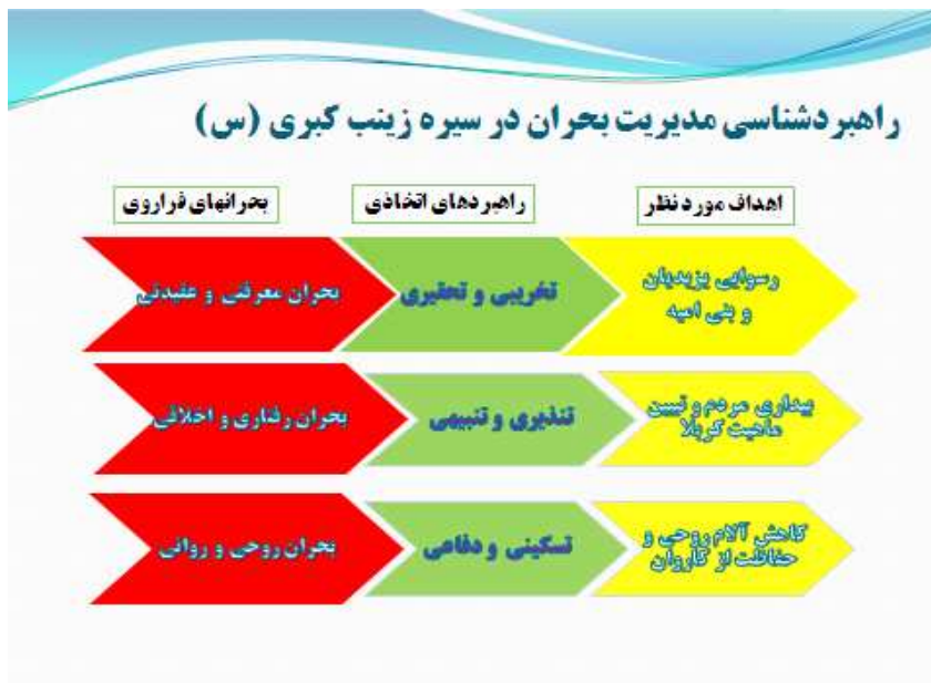
نمودار ۲. راهبردشناسی مدیریت بحران در سیره حضرت زینب (س)