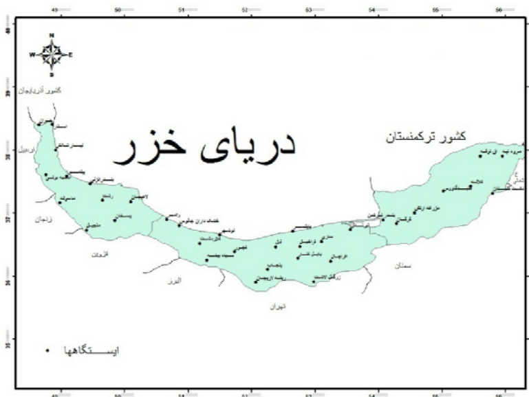
شکل (۱) نقشه پراکندگی ایستگاه‌های منطقه مورد مطالعه (شمال ایران)