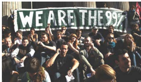
تصویر ۱. شعار اصلی فعالان جنبش اشغال وال‌استریت

«والاستریت را اشغال کن» را یک جنبش اجتماعی نام‌گذاری کرد (dcourier, 2011).