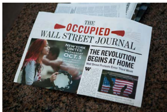
تصویر ۵. نمونه‌ای از روزنامه‌های چاپ شده توسط فعالان جنبش اشغال وال‌استریت