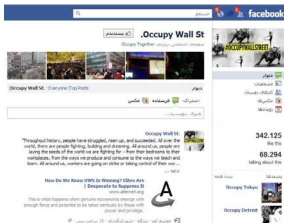
تصویر ۴. بزرگ‌ترین صفحه حامیان فیس‌بوکی جنبش وال استریت

در اول اکتبر «بوستون را اشغال کنید» در توئیتر نمایان شد؛ پس از ۲ هفته «دنور را اشغال کنید» و «داکوتای جنوبی را اشغال کنید» و ... در صفحه اینترنت ظاهر شدند (همان). صفحه «وال استریت را اشغال کنید» فیس‌بوک (تصویر ۴) نیز در ۱۹ سپتامبر به همراه فیلم‌های معترضان اولیه در یوتیوب به عرصه اینترنت پا گذاشت. این صفحه هم‌اکنون بیش از ۳۴۰ هزار عضو دارد که از این میان تنها حدود ۷۰ هزار نفر در گفتگوها فعال هستند. از سوی دیگر علاوه بر آمریکا اکنون صفحات فیس‌بوک برای اشغال کشورها یا شهرهایی از کشورهای کانادا، دانمارک، پرتغال، ایتالیا، بریتانیا، سوئد، فرانسه، آلمان، اسپانیا، کلمبیا، استرالیا و ... نیز راه‌اندازی شده است.