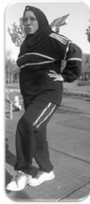
شکل شماره (۱). آزمون تعادلی تک پا غیر برتر و چشم باز

برای اندازه گیری تعادل پویا از آزمون ستاره ۱ استفاده شد. این آزمون، یک شبکه با هشت خط در جهت های مختلف با زاویه ۴۵ درجه است. هشت خط براساس وضعیت خط نسبت به پای واقع در زمین نامگذاری می شود که شامل جهت های قدامی (A)، قدامی - داخلی (AM)، داخلی (M)، خلفی - داخلی (PM)، خلفی (P)، خلفی - خارجی (PL)، خارجی (L) و قدامی - خارجی (AL) است. شبکه ستاره با استفاده از نوارچسب (شکل شماره (۲))، متر نواری و یک نقاله به طور مستقیم روی یک سطح غیر صیقلی رسم شد. برای تعیین پای برتر از آزمودنی خواسته می شد توپی را که جلو او روی زمین قرار داشت، شوت کند.