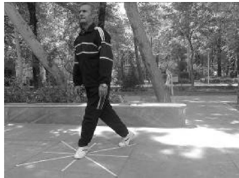
شکل شماره (۳). ریش خلفی خارجی

آزمونگر خطاهایی را که ممکن است طی آزمون رخ دهد، برای آزمودنی ها توضیح می داد. این خطاها عبارتند از: آزمودنی پای اتکا را از وسط شبکه ستاره بردارد، تعادل آزمودنی در طول هر بار دستیابی کم شود، آزمودنی وضعیت شروع و برگشت را نتواند به مدت یک ثانیه حفظ کند، پای آزمودنی در هر نقطه در حالی که تحمل وزن روی پای اتکا را دارد با خط تماس پیدا کند (برسل ۱ ، یانکر ۲ ، ۲۰۰۷).