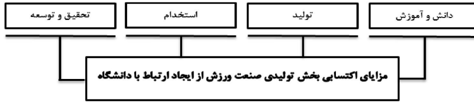
شکل شماره (۱) مدل مفهومی تحقیق

شکل ۱ مدل مفهومی تحقیق حاضر را ارائه کرده است که عوامل مورد بررسی پژوهش در آن ارائه شده است.