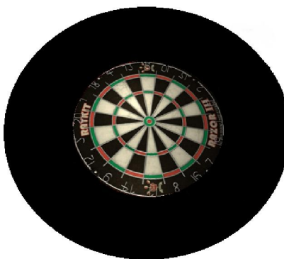
شکل (۱). نمونه‌ای از دارت استاندارد به همراه رنگ زمینه مشکی برای گروه تمرینی

برای اجرا و تمرین مهارت دارت از صفحه دارت و پیکان دارت استاندارد استفاده شد. همچنین از چک لیست برای ثبت اطلاعات در هر جلسه استفاده شد. برای ایجاد زمینه‌ها با رنگ‌های متفاوت و مورد نظر محقق، از آکاسیف‌های رنگی مورد استفاده قرار گرفت. برای گروه‌های با رنگ زمینه، صفحه دارت در وسط آکاسیف با رنگ مورد نظر قرار می‌گرفت و برای گروه کنترل بدون رنگ زمینه بود. اندازه هر آکاسیف از انتهای دارت به سمت خارج ۲۵ سانتی‌متر بود (شکل ۱).