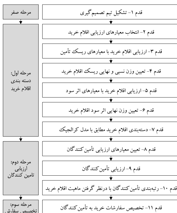
شکل ۳- روش پژوهش شامل دسته بندی اقلام خرید، ارزیابی تأمین کنندگان و تخصیص سفارشات

از قطعات مورد نیاز خود به صورت برون‌سپاری گرفته است. تعداد این اقلام ۱۰ عدد است و تخصیص سفارش این ۱۰ قلم، حوزه مورد بحث این مقاله است. به این منظور قدم‌های زیر پیشنهاد می‌شود (شکل ۳)