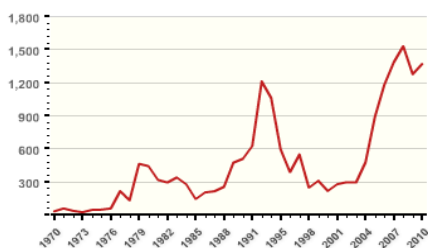
نمودار ۲- وقایع تروریستی گزارش شده از ۱۹۷۰ تا ۲۰۱۰ در خاورمیانه و شمال آفریقا

این مقاله مروری فشرده بر مفاهیم و محورهای اساسی، پیشینه و مطالعات تجربی در خصوص عوامل و پیامدهای اقتصادی تروریسم دارد. البته فعالیت‌های ضد تروریسم نیز تحلیل و پیامدهایی اقتصادی دارند که به علت محدودیت زمان، در مجالی دیگر بررسی می‌شوند.