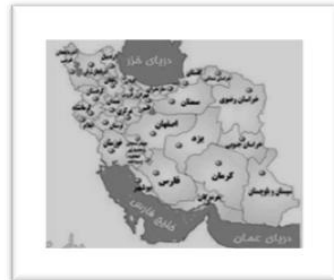
شکل شماره‌ی سه- موقعیت شهرستان آران و بیدگل در استان اصفهان