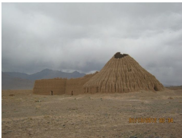
شکل ۱- یخدان لنگر- بخش ماهان شهرستان کرمان

محلی، تکثیر و اشاعه نتایج مطالعات برنامه‌ریزی‌های انجام شده برای توسعه گردشگری روستایی در منطقه در میان مسئولان، مدیران و برنامه‌ریزان پیشنهاد می‌گردد.