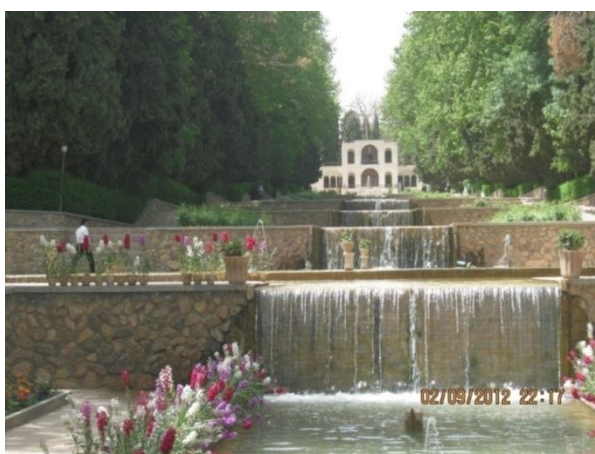
شکل ۲- باغ شاهزاده ماهان- بخش ماهان شهرستان کرمان