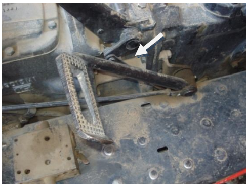
شکل ۳- مفصل انتقال نیرو بین پدال و دیسک در مکانیزم کلاچ‌گیری تراکتور MF285

راستای نیروی اعمال شده با اصطکاک بیشتری در مفصل خود چرخش کند. بر این اساس به شرکت سازنده این تراکتور پیشنهاد می‌شود برای کاهش نیروی ورودی برای کلاچ‌گیری تراکتور MF285 و رفاه حال بیشتر رانندگان تمهیدات لازم صورت گیرد. با توجه به این که این تراکتور جزو تراکتورهای سبک محسوب می‌شود و میزان تولید و استفاده از آن در بخش کشاورزی ایران به مراتب بیشتر از تراکتور MF399 است (AJMDC, 2012). توجه به بهینه‌سازی آن نقش بیشتری در بهداشت حرفه‌ای بخش کشاورزی خواهد داشت. به‌عنوان یک پیشنهاد مقدماتی توصیه می‌شود، مفصل انتقال نیرو بین پدال و دیسک در مکانیزم کلاچ‌گیری که در شکل ۳ نشان داده شده است، از چدن ریخته‌گری ساخته شود. زیرا اگر این قطعه از این جنس ساخته شود، هنگام اعمال نیرو به پدال، تغییر شکل قابل توجهی نداد و از صرف نیروی بیشتر جلوگیری می‌شود. آزمایش‌های مقدماتی نشان دادند که با انجام این کار بر روی مکانیزم کلاچ‌گیری تراکتور MF285 میزان نیروی مورد نیاز کلاچ‌گیری می‌تواند تا ۷۰ نیوتن کاهش یابد.