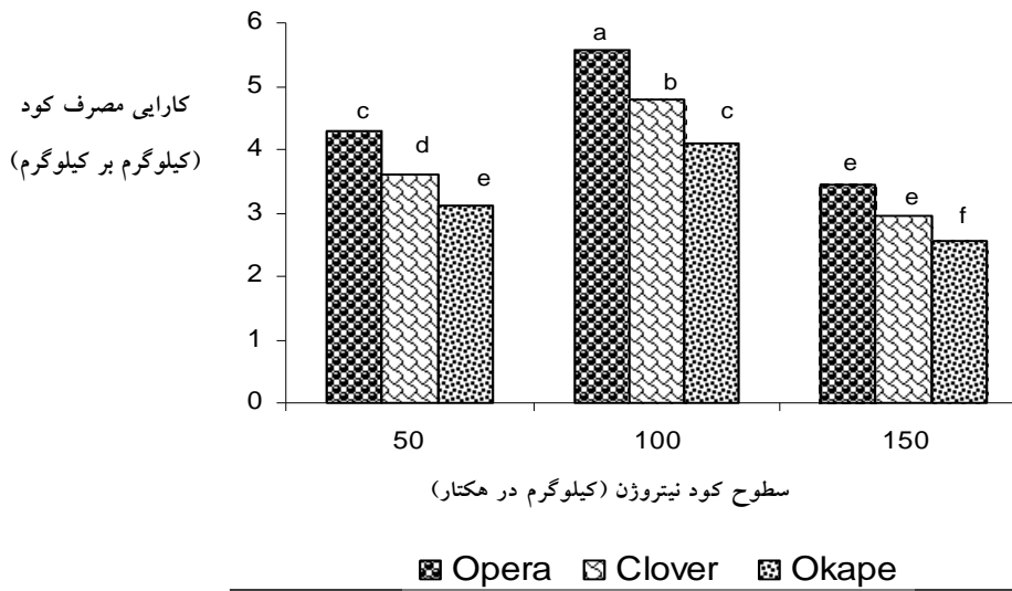
شکل ۳ - تاثیر سطوح مختلف کود نیتروژن بر کارایی مصرف کود در ارقام کلزا