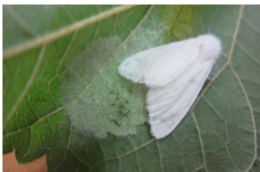
شکل ۱- پروانه ماده برگ‌خوار سفید اشجار در حال تخم‌ریزی روی برگ توت (اصل)