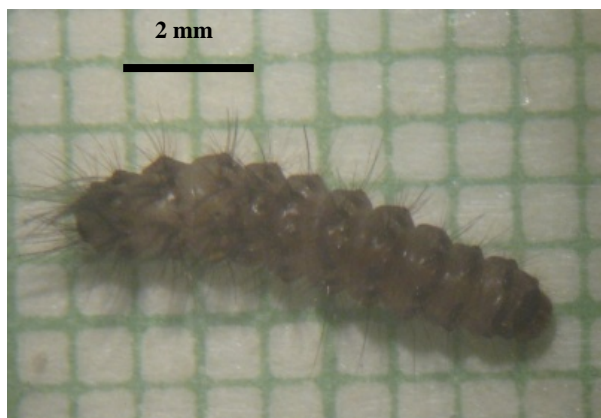
شکل ۵- لارو سن سوم شب‌پره A. phegea (اصلی)