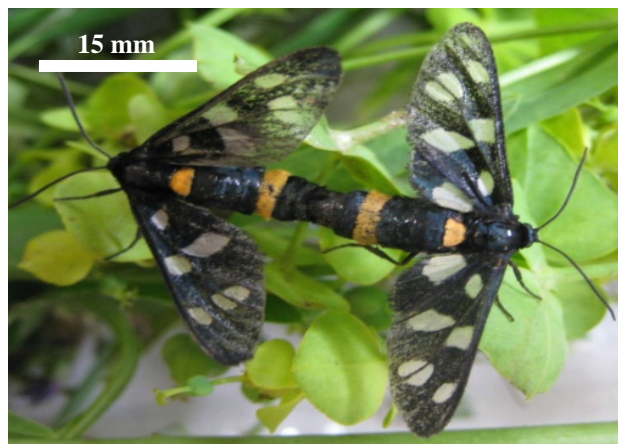
شکل ۱- حشرات کامل نر و ماده شب‌پره A. phegea در زمان جفت‌گیری (اصلی)