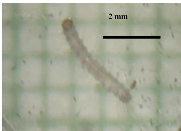
شکل ۳- لارو سن اول شب‌پره A. phegea (اصلی)