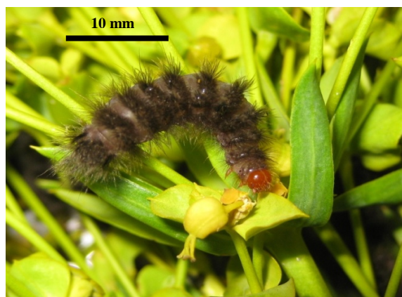
شکل ۷- لارو سن پنج شب‌پره A. phegea (اصلی)