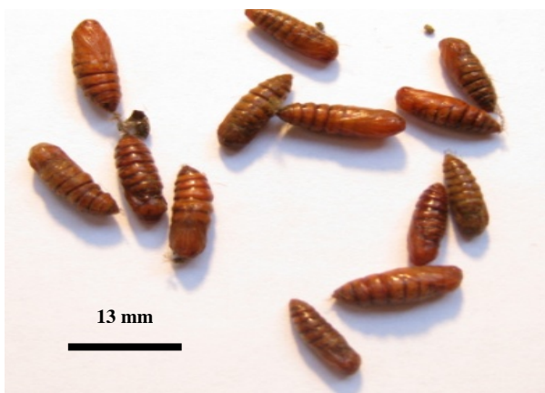
شکل ۸- شفیره‌های شب‌پره A. phegea (اصلی)