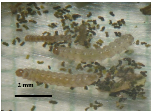
شکل ۴- لارو سن دوم شب‌پره A. phegea (اصلی)