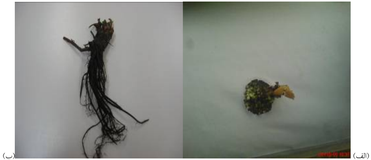
شکل ۲. الف) مرگ گیاهچه و ب) پوسیدگی ریشه

برای خالص سازی پرگنه‌ها به روش نوک ریشه، بلوک‌های میسلومی ۵-۶ میلی‌متر مربع از حاشیه پرگنه‌های جوان در حال رشد روی محیط کشت نیمه انتخابی آرد ذرت - آگار به محیط آب آگار ۰.۲٪ انتقال داده شد. بعد از ۲۴ تا ۴۸ ساعت، با استفاده از روش کشت نوک ریشه، قطعات جدا شده به محیط کشت نیمه انتخابی آرد ذرت - آگار انتقال یافتند. بعد از رشد ریشه‌ها و ایجاد پرگنه‌ها، به منظور تشخیص قطعی جنس، مجدداً با استفاده از بذره‌های شاهدانه طعمه‌گذاری شدند (۲۵).