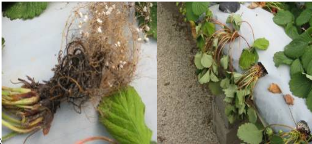
شکل ۱. الف) گیاهچه توت فرنگی در حال پژمردگی در کشت هیدروپونیک در گلخانه و ب) پوسیدگی ریشه گیاهچه توت فرنگی