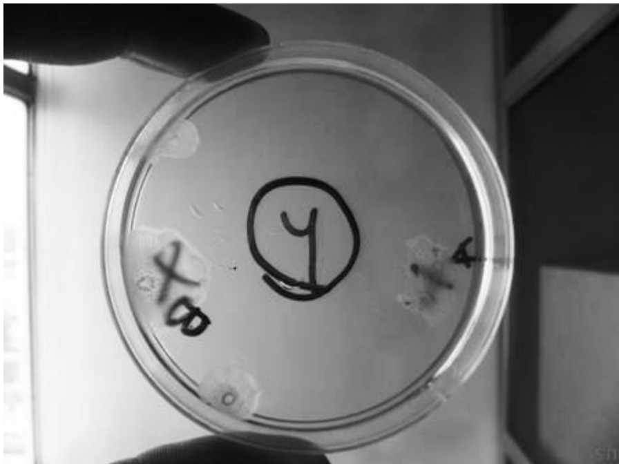
شکل ۲. کلونی‌های رنگ‌آمیزی شده لاکتوباسیلوس در یک نمونه تصادفی در روز پیش از پایان دوره نگهداری (کشت دوم)