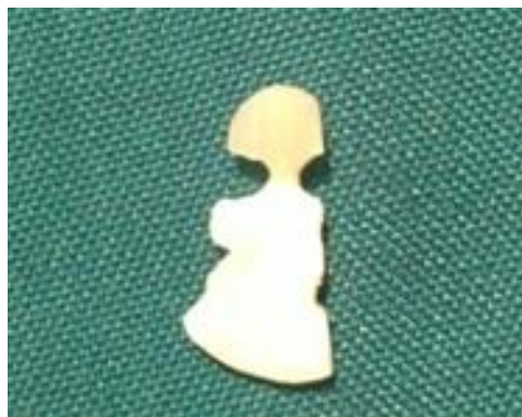
شکل ۱: نمونه آماده شده به صورت ساعت شنی

که شکست بین کامپوزیت و عاج ایجاد شد. سپس نیروی شکست بر حسب واحد مگاپاسکال ثبت و پس از دسته‌بندی و کدگذاری توسط رایانه و با استفاده از آزمون‌های آماری Post hoc test, T test, Two-way Anova, Anova, Tukey HSD تجزیه و تحلیل گردیدند.