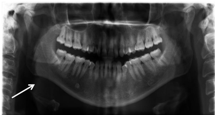
تصویر ۲: یک نمونه کلیشه ی پانورامیک با تصویر واضحی از سنگ غده بزاقی تحت فکی