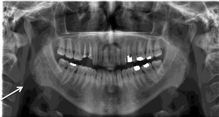
تصویر ۱: یک نمونه کلیشه پانورامیک با تصویر واضحی از تونسیلولیت

بزرگنمایی در اندازه‌گیری‌ها محاسبه شد. نسخه ۱۷ و آزمون آماری Chi-square, Fisher exact test و Odds Ratio مورد تجزیه و تحلیل قرار گرفت. SPSS نرم‌افزار استفاده از نرم‌افزار SPSS