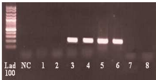
شکل ۱. محصول ۳۲۰ bp در روش Allele-specific PCR مخلوط A: تهیه شده توسط پرایمرهای TB و MT مخلوط B: تهیه شده توسط پرایمرهای TB و MB Rv: مایکوباکتریوم توبرکلوزیس سویه استاندارد H37Rv Bov: مایکوباکتریوم بوویس.

مایکوباکتریوم بوویس و ۹۵ نمونه مایکوباکتریوم توبرکلوزیس تشخیص داده شد. شکل ۱ گویای حضور یا عدم حضور باند ۱۸۵ bp جدا کننده دو گونه مایکوباکتریوم است.