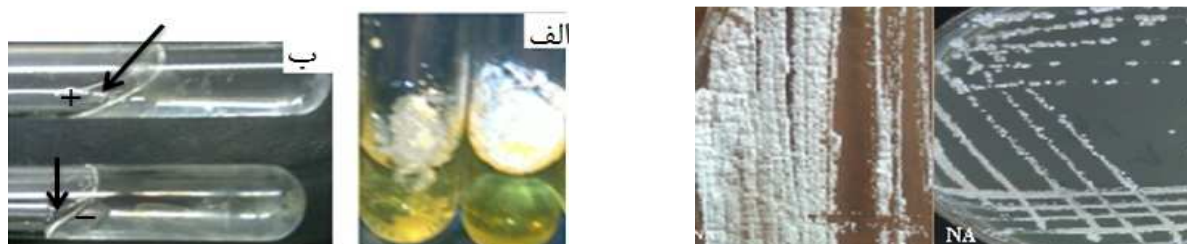
شکل ۲. کلنی نوکاردیا بر روی محیط نوترینت آگار