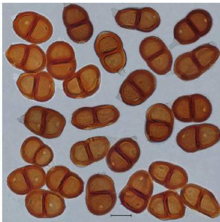
شکل ۲. Puccinia galatica روی Carduus pycnocephalis ، تلیوسپورها، خط مقیاس ۲۰ میکرومتر Fig. 2. Puccinia galatica on Carduus pycnocephalis , teliospores, Bar=20 \mu m