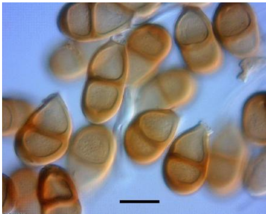
شکل ۱. Puccinia sherardiana روی Malvella sherardiana ، تلیوسپورها، خط مقیاس ۲۰ میکرومتر Fig. 1. Puccinia sherardiana on Malvella sherardiana , teliospores, Bar=20 \mu m.