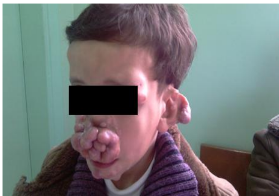
شکل شماره (۲): ندول‌های ناحیه بینی و گوش و چانه