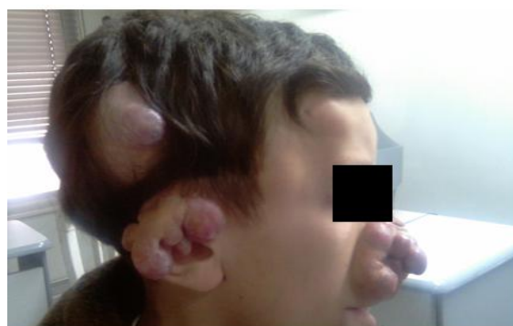
شکل شماره (۱): تومور و ندول‌های متعدد سرو صورت

مطالعات رادیولوژی: وجود توده‌های نسج نرم در گرافی جمجمه و وجود ضایعات اوستئولیتیک و اروزیون و اسکروتیک مارژین در انتهای فالنگس دیستال اولین و سومین انگشت پا مشاهده شد. سی تی اسکن جمجمه، شکم و لگن به جز توده‌های نسج نرم نرمال بودند. در پاتولوژی: وجود کلاژن و فیبروبلاست‌ها در زمینه ماتریکس هیالینی و توزیع وسیع و جاگیری فیبروبلاست‌ها در یک ماتریکس ائوزینوفیلی بیشکل مشخص است. بعضی از سلول‌های استروما در فضاهای حفره‌ای (لاکونا) موجودند (سلول‌های کوندروئیدی).