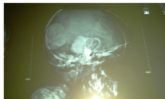
شکل شماره (۷): تورم نسج نرم درگرافی جمجمه

در مورد این بیمار باوجود ضایعات ندولار وتومورال متعدد به خصوص در ناحیه سر و صورت، هایپرتروفی لثه، کنتراکچر مفاصل و یافته‌های رادیولوژیکی و تیپیک پاتولوژی (ماتریکس هیالینی در درم) از تشخیص فیبروماتوزیس هیالینی جوانان حمایت می‌کند. این بیماری نادر ژنتیکی است و کمتر از ۷۰ مورد در دنیا گزارش شده است، اتیولوژی این بیماری زیاد مشخص نشده ولی افزایش سنتر کندروئیتین در فیبروبلاست‌های پوستی کشت شده ازبافت تومورال دیده شده است. در این بیماری اختلال سنتر گلیکوزامینوگلیکان نیز ذکر شده است و به نظر می‌رسد اشکال در سنتر کلاژن مکانیسم اصلی پاتولوژیکی این بیماری باشد. دو شکل مجزای این بیماری شامل: یک فرم لوکالیزه که بارشد آهسته ضایعات همراه است و یک فرم منتشر که بارشد سریع وشدید تومورال همراه است. این بیماری اتوزوم مغلوب منتقل میشوددر اوایل کودکی و نوجوانی علائم آشکار می‌گردد. اغلب بیماران هایپرتروفی ژنژیوا وافتادن دندان، کنتراکچر