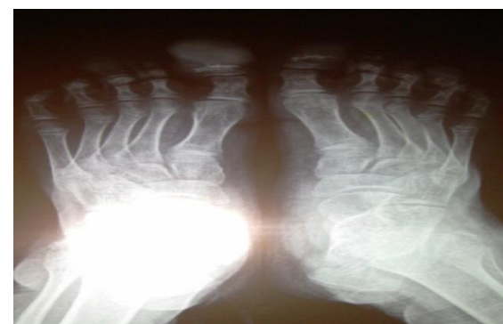
شکل شماره (۸): اروزبون و اسکروتیک مارژین انتهایی فالنگس انگشتان پا