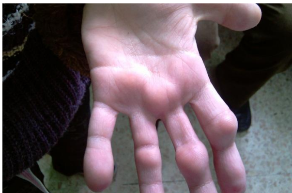
شکل شماره (۴): ندول‌های دست

در معاینه بیمار پسر نوجوان با ظاهر رنگ پریده و مضطرب بود. در معاینه پوستی ندول‌های متعدد با ابعاد مختلف (قطر بالای ۱ سانتی‌متر) و تومورهای بزرگ زیر جلدی در نواحی سر، صورت، و اندام‌ها مشاهده می‌شد، این ندول و تومورها در لمس قوام لاستیکی داشته، به رنگ پوست تا اریتماتو و بدون درد بودند. بیمار شروع این ضایعات را از ناحیه بینی و به شکل پاپول ذکر می‌کند که بعداً به سرعت گسترش یافته و کل بینی، گوش خارجی، اسکالپ، چانه، کف دست‌ها، بازوها و روی انگشتان پاها در گیر شده‌اند. مخاطات دهان هایپرتروفی شدید لثه و افتادگی اکثر دندان‌های بیمار موجود بود و این موجب اشکال در تغذیه و لاغری شدید او شده بود. معاینه اندام‌ها فلکشن کنترکچور و محدودیت حرکتی مفاصل آرنج بارز بود در سایر اندام‌ها بجز ندول و تومورهای فوق‌الذکر نکته خاص دیگری وجود نداشت. بهره هوشی بیمار طبیعی بود. آزمایشات بیمار بجز آنمی هیپوکروم میکروسیتیک مختصر نکته دیگری نداشت. PPD بیمار منفی و گرافی قفسه سینه طبیعی بود.