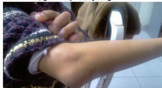
شکل شماره (۶): فلکشن کنتراکچر مفصل آرنج

شکل‌های شماره (۹ و ۱۰): وجود کلاژن و فیبروبلاست‌ها در زمینه ماتریکس هیالینی و توزیع وسیع و جاگیری فیبروبلاست‌ها در یک ماتریکس اتوزینوفیلی بیشکل مشخص است. بعضی از سلول‌های استروما در فضاهای حفره‌ای (لاکونا) هستند (سلول‌های کوندروئیدی)