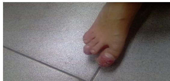
شکل شماره (۵): توده انگشتان پا