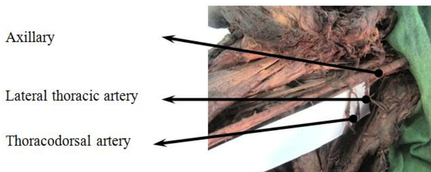
شکل شماره (۲): تنه‌ی مشترک شریان‌های توراسیک خارجی و توراکی دورسال

شریان ساب اسکاپولار پس از جدا شدن سیر کومفلکس اسکاپولار است، با شریان توراسیک خارجی تنه‌ی مشترکی دارد (شکل ۲)، شریان توراسیک خارجی در جدار خارجی توراکیس به همراه عصب لانگ توراسیک طی مسیر کرده و به جدار توراکیس خون‌رسانی می‌کند.