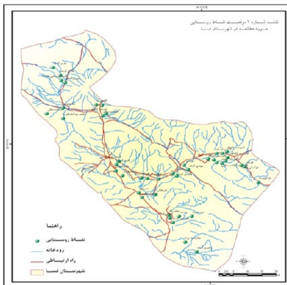
شکل ۳: نقشه پراکنش نقاط روستایی در محدوده فسا سیاسی شهرستان فسا

د- تعیین وزن و درجه اهمیت خصوصیت‌ها: برای بیان اهمیت نسبی خصوصیت‌ها و معیارها باید وزن نسبی آنها را تعیین کرد. در این زمینه روش‌های متعددی مانند Linmap، AHP، ANP، آنتروپی شانون، بردار ویژه و مانند آن وجود دارند که متناسب با نیاز می‌توان آنها را مورد استفاده قرار داد. در این تحقیق از روش ANP برای تعیین وزن شاخص‌ها استفاده شده است.