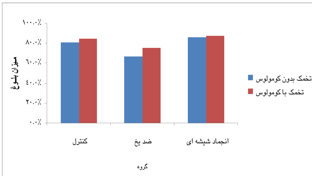
نمودار ۲: مقایسه میزان بلوغ تخمک‌های ژرمینال و زیکول با و بدون کومولوس در گروه های کنترل و مداخله