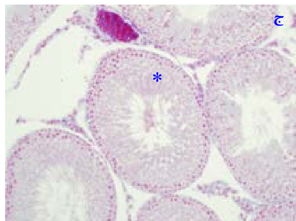
شکل ۱: تصاویر میکروسکوپی از بافت بیضه موش‌های صحرایی بالغ در گروه‌های مختلف، تیمار شده با پارائونایل فنل ( 250 \text{ mg/kg/day} ) و ویتامین E ( 100 \text{ mg/kg/day} ) (الف) آرایش طبیعی اپی تلیوم زایشی در گروه کنترل (ستاره) (ب) کاهش ارتفاع اپی تلیوم زایشی، تخریب اسپرماتوژنز، بی‌نظمی و واکوئل شدن اپی تلیوم زایشی (نوک پیکان) و افزایش در فضای بین توبولی در گروه تیمار شده با پارائونایل فنل (ج) آرایش تقریباً طبیعی اپی تلیوم زایشی و اسپرماتوژنز طبیعی (ستاره) در گروه تیمار شده با پارائونایل فنل توام با ویتامین E برش‌های ۵ میکرونی، رنگ‌آمیزی هایدن-هاین-آزان، بزرگ‌نمایی 20\times

معنی داری نشان نداد. این در حالی است که کاهش آماری معنی داری در میانگین قطر لوله‌های منی ساز ( P < 0/001 )، ارتفاع