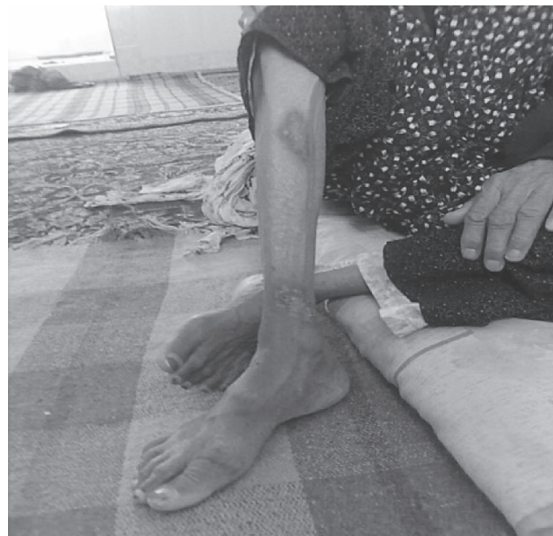
شکل ۱- ضایعات پوستی سالک در بیمار