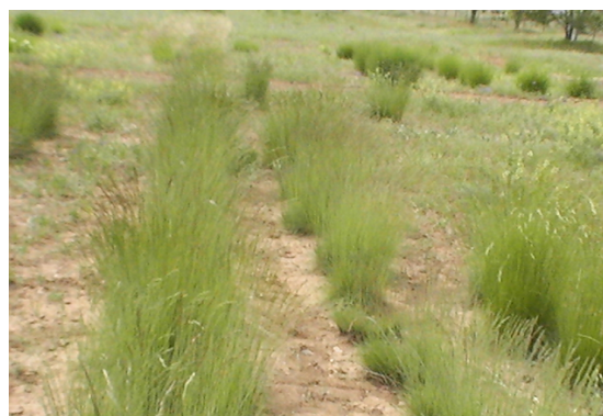
شکل ۱- گونه Elytrigia libanoticus L. در خزانه

ارزیابی از سال ۱۳۸۲ شروع گردید. شادابی گیاه همراه با برآورد تولید بذر و علوفه و سایر فاکتورهای رشد زنده‌مانی اکسشن‌ها نیز اندازه‌گیری شد. برای تعیین شادابی و در نهایت برای بنیه و زنده‌مانی به روش کیفی (درجه ضعیف، متوسط، خوب و عالی) ارزیابی شدند. در نهایت پس از تبدیل شدن ارزیابی کیفی به عدد، محاسبات آماری انجام شد.