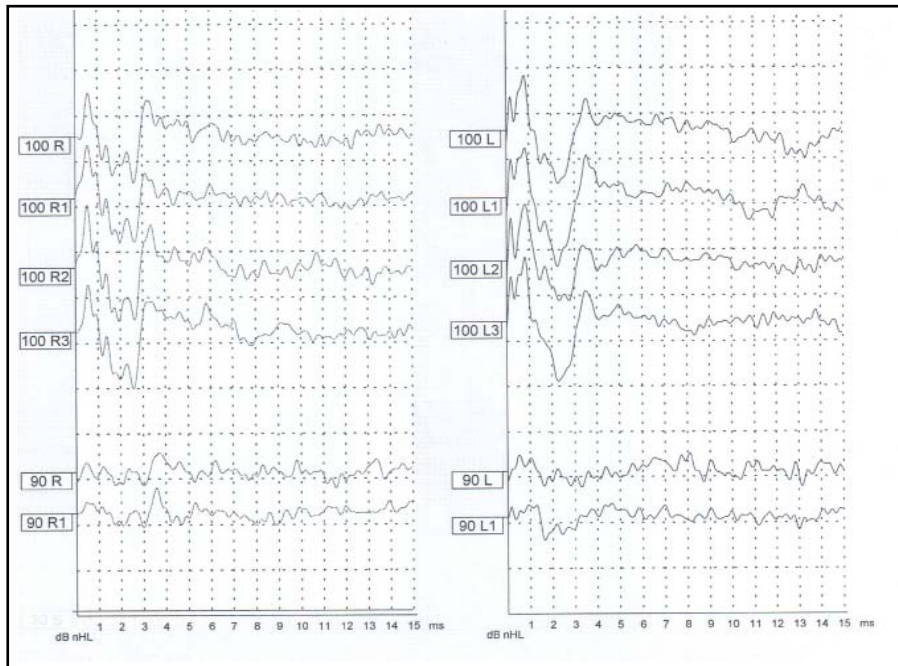
شکل ۲- نمونه ASNR ثبت شده از دو گوش یک کودک کم‌شنوای عمیق در سطح شدت آستانه (۱۰۰ دسی‌بل HL)

شدتی ۹۰ تا ۱۰۰ دسی‌بل، ASNR در محدوده زمان نهفتگی ۰/۲۱۱ تا ۰/۰۸۵ میلی ثانیه با محدوده دامنه ۳/۴۴ تا ۲/۷۲ میکروولت ثبت شد. در شکل ۲، نمونه پاسخ ثبت شده از دو گوش یکی از کودکان در سطح شدت آستانه نشان داده شده است. VEMP در کلیه گوش‌های دارای ASNR (۴۰٪) وجود داشت. در ۲۲/۲۲ درصد (۸ گوش) از گوش‌های بدون ASNR (۶۰٪) یا ۱۳/۳۳ درصد از کل ۶۰ گوش مورد بررسی، VEMP علی‌رغم نبود ASNR، قابل ثبت بود. در جدول ۱، میانگین و انحراف معیار زمان نهفتگی امواج p1 و n1 و دامنه p1n1 پاسخ VEMP و همچنین زمان نهفتگی و دامنه ASNR آورده شده است.