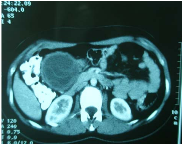
تصویر ۲ - سی تی اسکن کیست هیداتید امتنوم

در آزمایشات بیمار فرمول شمارش گلبول های خون و تست های کبدی طبیعی و تست الیزا منفی بوده است.