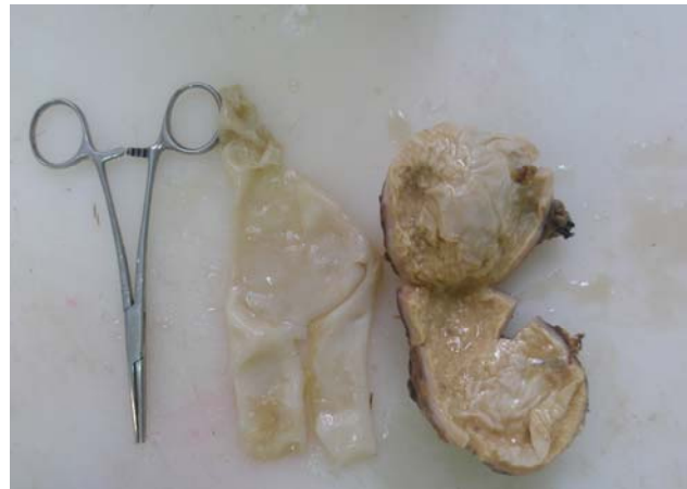
تصویر ۳- نمای ماکروسکوپی کیست خارج شده از شکم بیمار

به هر حال در بررسی مقالات گزارش شده تعداد موارد کیست هیداتید منفرد اولیه امتنوم بسیار محدود است. ۱۶ هدف از درمان کیست هیداتید برداشتن کیست فعلی و جلوگیری از عود و عوارض است. جراحی خواه به صورت کنسرواتو و یا به صورت رادیکال هنوز درمان انتخابی کیست است. نوع عمل بستگی به تعداد و محل قرار گرفتن کیست‌ها دارد و شامل برداشتن کامل کیست، پری سیستکتومی و مارسوپالیزاسیون