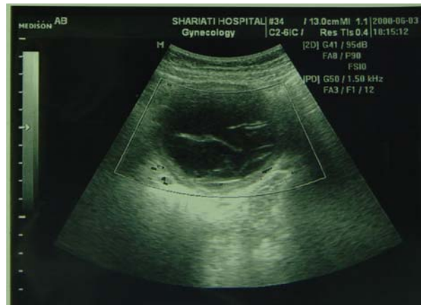
تصویر ۱ - سونوگرافی شکم، وجود کیست هیداتید در امتنوم

بیمار خانم ۲۱ ساله متأهل صاحب یک فرزند ۸ ماهه که بعد از گذاردن آی یو دی دچار درد شکم می گردد و برای بررسی محل آن از وی سونوگرافی شکم به عمل می آید که یک کیست با ابعاد ۶۳×۷۶ میلی متر با مشخصات کیست هیداتیک (حاوی جدار دو لایه و سپتا و دیواره های داخلی) در ناحیه پور توهایپتیس شکم مشاهده می شود (تصویر ۱).