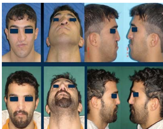
تصویر ۴- دفورمیتی شدید بینی در آقای ۲۵ ساله، عکس‌های پس از عمل ۲ سال پس از جراحی گرفته شده است.