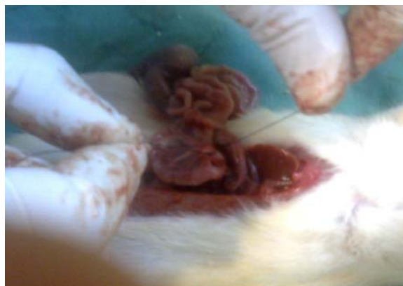
تصویر ۲- مرحله لیگاتور شریان مزانتریک فوقانی در رت مورد مطالعه

همانگونه که در جدول بالا دیده می‌شود در گروه رت‌هایی که لاپاراتومی شدند و عروق مزانتریک فوقانی در آنها لیگاتور شد و سطح دی دایمر سرم یک ساعت پس از لیگاتور گرفته شد (گروه ۲) نسبت گروهی که تنها لاپاراتومی شدند و نمونه