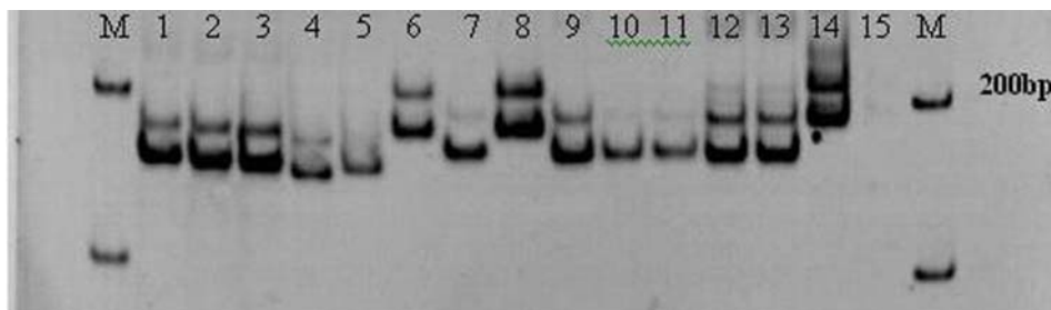
شکل ۲- نمونه ژل پلی اکریل آمید ۶ درصد با استفاده از نشانگر QAAT074 نمونه‌ها به ترتیب از ۱ تا ۱۴ مربوط به مورفوتیپ‌های 881014، 881013، 881021، 881022، 881031، 881032، 881041، 881043، 881056، 881057، شماره ۱۵ کنترل منفی و M نشانگر وزنی در ابتدا و انتهای ژل بودند.

نشانگرهای ریزماهواره مورد تایید قرار گرفت. البته در گروه‌بندی خوشه‌ای بعضی از مورفوتیپ‌ها تفاوت چندانی نداشتند که نمونه‌های ۴۲ و ۴۳ از این نوع ژنوتیپ‌ها هستند و آن دو با نمونه ۳۶ نیز تفاوت کمی داشتند. در گروه‌بندی به مختصات اصلی شباهت زیاد بین دو مورفوتیپ ۴، ۸ و همچنین مورفوتیپ‌های ۳۲، ۳۴ و ۴۰ در گروه A وجود داشت (شکل ۳). در چنین حالتی بررسی آنها و تعیین مورفوتیپ‌های مشابه در هر دو روش گروه‌بندی برای حذف نمونه‌های مشابه با توجه به صفات مورفولوژیک و