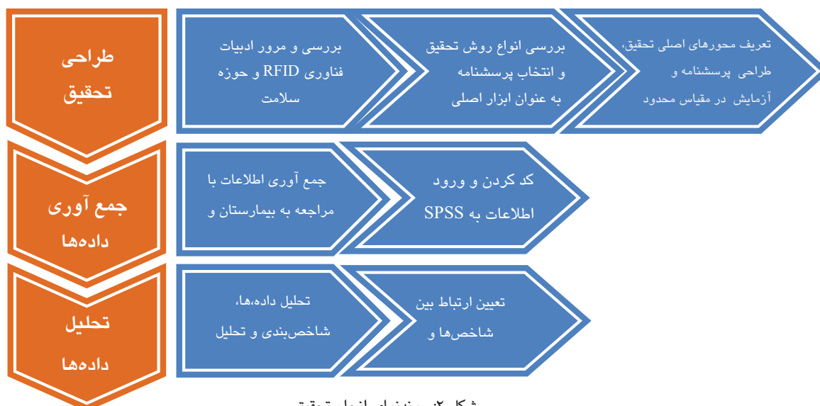
شکل ۲: روندنمای انجام تحقیق

و استفاده از فناوری‌های نوینی چون فناوری رد فاشگر می‌توان در جهت رفع نقاط ضعف گام برداشت و به بهره‌وری قابل توجهی در این بیمارستان رسید.