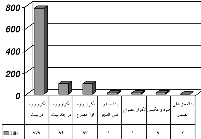
نمودار شماره ۲: انواع تکرارهای مرئی در اشعار فرید