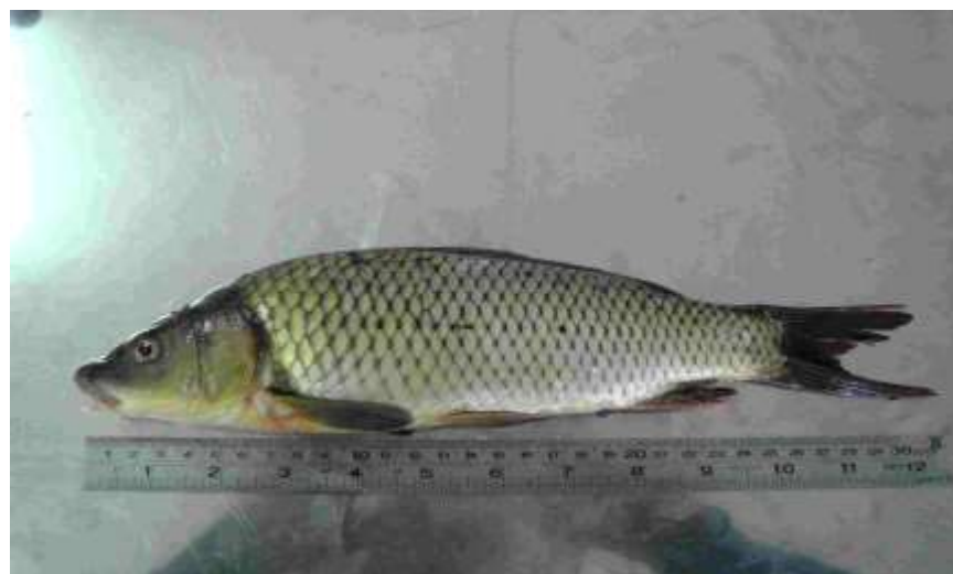
شکل ۵- ماهی کپور معمولی Cyprinus carpio