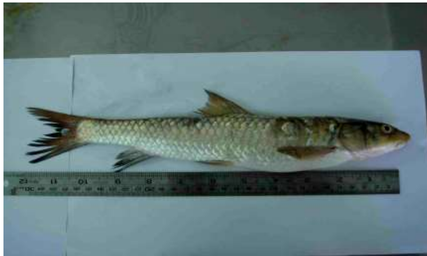
شکل ۳- ماهی شیربت Barbus grypus