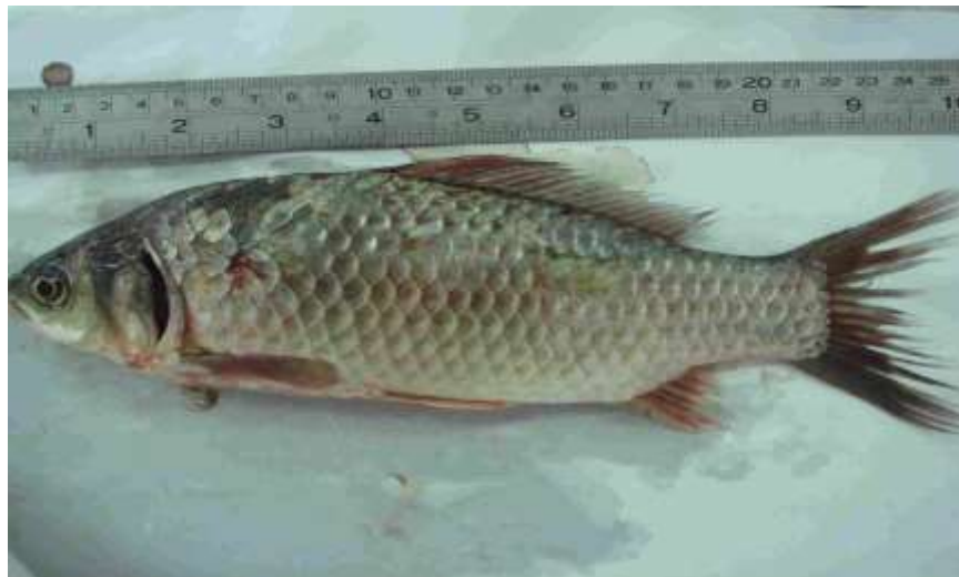
شکل ۴- ماهی کاراس Carassius carassius