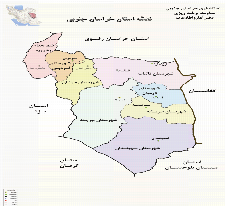
شکل ۵. نقشه استان خراسان جنوبی

در این مدل، جریمه کمبود کالا برای کالای ۱ و ۲ هر واحد ۱۰۰۰ تخمین زده شده است و ضرایب توابع هدف در روش معیار جامع برای سه تابع هدف اول ۰/۱ و برای تابع هدف چهارم ۰/۷ و همچنین مقدار I=1 در نظر گرفته می شود که بر اساس نظر خبرگان می باشد. همان گونه که در جدول (۱۱) دیده می شود در دوره اول سه شهر بیرجند، نهبندان و قاین به عنوان انبارهای موقت انتخاب می گردد، که این انتخاب با توجه به میزان تقاضا و هزینه جابه جایی بین مناطق مختلف یعنی مناطق آسیب دیده و مراکز تامین صورت گرفته است. در دوره بعد چون میزان تقاضاها تغییر می کند بنابراین، مدل تصمیم به ایجاد یک انبار موقت جدید در شهرستان فردوس می نماید. همچنین با بررسی جدول (۱۲) مشاهده می شود که در اکثر حالات، سعی شده است کل تقاضای هر منطقه آسیب دیده از طریق یک انبار موقت تامین گردد؛ زیرا این امر موجب کاهش هزینه های جابه جایی می گردد. با بررسی نتایج حاصل از مدل و داده های ورودی مساله مشاهده می شود استقرار انبارهای موقت بر اساس میزان فاصله از تامین کننده و همچنین فاصله انبار موقت با مناطق آسیب دیده صورت می پذیرد. همچنین بر اساس تابع هدف دوم مدل سعی می شود همه مناطق آسیب دیده تا حدودی با نسبت برابر کالا دریافت کنند تا رعایت انصاف در توزیع کالا صورت گرفته باشد.