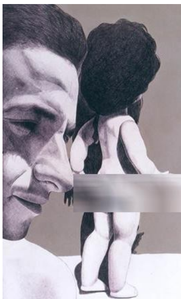
تصویر شماره 2

موانعی بر سر راه تجربه‌ای کامل و بی‌واسطه از زندگی و بلوغ و تکامل ایجاد کرده و دغدغه‌هایی که در ذهن و زندگی فرد می‌آفرینند. زنانی که شرایط از جسمیت‌شان موجودیتی عروسک‌گونه آفریده و جسمیت‌شان تنها ویژگی جنسیت‌شان تلقی می‌شود و مردانی که چون قربانیان این شرایط از تجربه‌ی زندگی و بلوغ و تکامل وامی‌مانند، چنانکه چون کودکانی نابالغ، حسرت بازی را با خود تا دوران بزرگسالی حمل می‌کنند و امکان رشد و تجربیاتی کامل‌تر را نیز از دست می‌دهند.