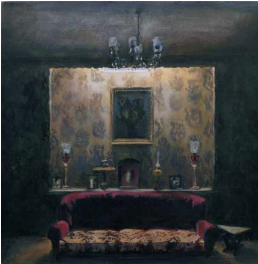
تصویر شماره 3

تأمل برانگیز است. این ترکیب بندی با استفاده از قرینگی و خطوط ایستای عمودی و افقی سکون و آرامش تصویر را بیشتر نیز می کند.