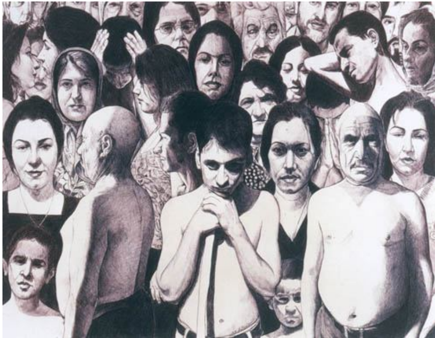
تصویر شماره 1

تصویر 1: سطحی مملو از فیگورهای متراکم انسانی که هر یک به دقت شخصیت‌پردازی شده‌است. بی‌شکلی و تراکم این توده‌ی انسانی حس خفگی ناخوشایندی متبادر می‌کند؛ حسی که البته در چهره‌ی خود فیگورها مشاهده شدنی نیست. هیچ ارتباط ملموسی بین افراد به مثابه عناصر تصویر و هم‌چنین اجزای یک کل واحد که از فضای کلی تأثیر می‌گیرند وجود ندارد؛ طوری که گویی هر یک فارغ از دیگران، در عوالم جداگانه‌ی خویش سیر می‌کنند. یگانه‌ی خاصیت وحدت‌بخش تصویر وجود منبع نوری واحد است که حس بودن در فضایی واحد را به‌وجود می‌آورد. شخصیت‌پردازی افراد البته چهره‌هایی کاملاً ملموس و مادی و روزمره آفریده که هر یک به راحتی حس همذات‌پنداری مخاطب را برمی‌نگیزد.