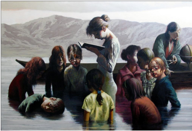
تصویر شماره 5

در تبیین جامعه‌شناختی چنین مفاهیم و تفاسیری که از اثر به دست دادیم - همانند اثر قبلی - محیط غیرمعمول زیست و تجربه‌ی فیگورهای انسانی قابل توجه می‌نماید. در تصویر «تجربه‌های روزمره»ی زندگی چون آموزش، تکامل و بلوغ افراد به قدری طبیعی و بی‌واسطه می‌نماید که تعارضی سخت با پیرامون نامعمول آن به وجود می‌آورد. تعارضاتی صلب و سخت که ذهن را به سمت تجربه‌های ناقص و ناکامل، اما گریزناپذیر زندگی هدایت می‌کند. تجاربی که با همه‌ی نواقص و تعارضاتش، حتی در شرایط غیرمعمول و نابهنجار اجتماع مان همچنان با قدرت به زیست خود ادامه می‌دهند. در حضور جغرافی‌دان نیز شاید بتوان تأثیرات غرب و تجدد بر اذهان و سبک زندگی و حتی غربی‌بودن شکل آموزش مدرسه‌ای را نیز پی‌گیری کرد؛ چنانچه تجدد ما در آغاز خود و در تصویرش در نقاشی کمال‌الملک نیز وامدار باروک است.