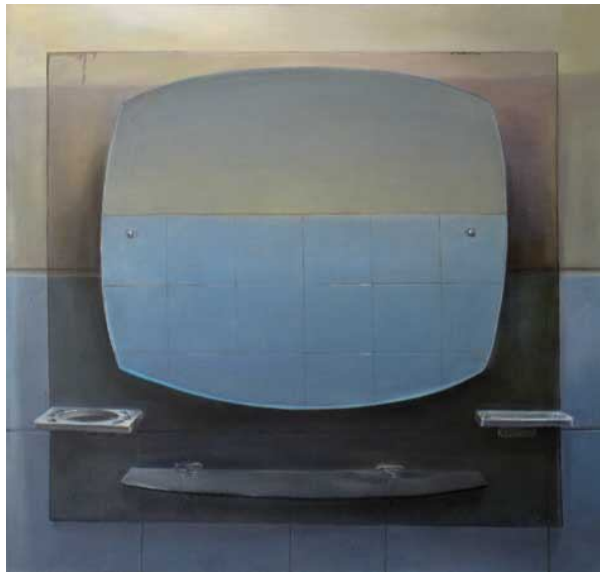
تصویر شماره 4

پر فراز و نشیب‌تر. این قاب گویی مخاطبی با حافظه‌ی مشترک را به درون تصویر فرامی‌خواند و او را در برابر آینه‌ای از زیست‌اش قرار می‌دهد. آینه همچنین نشانه‌ای است که دلالتی بر خودانتقادی دارد. این کار بر خلاف اکثر آثار افسریان عمق کمی را می‌نماید و حتی تصویر دیوار مقابل، که به واسطه‌ی انعکاسش در آینه به پلانی جلوتر منتقل شده است، به شدت از همین عمق کم نیز می‌کاهد و بیننده را در برابر دیواری سخت با تصلبی ناگوار مواجه می‌کند. این سختی انتظار کسی را می‌کشد که به واسطه‌ی حضورش به دلالت آینه معنا دهد. تصلبی که دور نیست تا آن را به سنت و اندیشه‌ای نسبت دهیم که به واسطه‌ی تکرار اشتباهاتمان با تصلب بیشتر مواجهش می‌کنیم. این ناگواری را چاره‌ای نیست جز آنکه خود را در قاب خودانتقادی تصویر زندگی‌مان ببینیم.