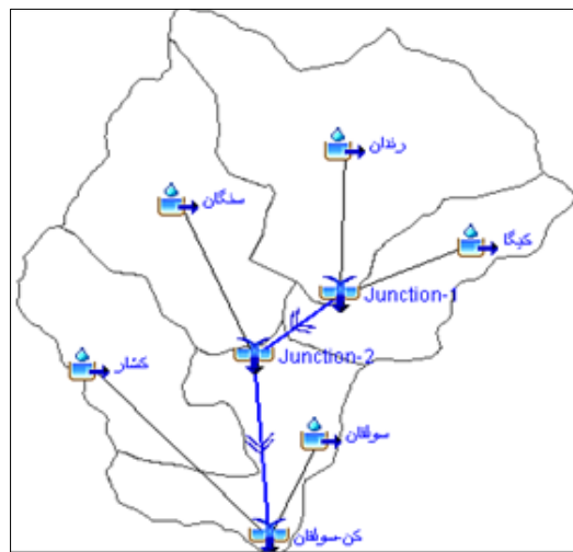
شکل ۲. زیرمدل حوزه آبخیز کن

اقلیمی، و شاخص‌های کنترلی تکمیل شود. در زیرمدل حوزه روش‌هایی وجود دارد برای تعیین تلفات اولیه، محاسبه رواناب سطحی، محاسبه آب پایه، و روندیابی سیل در رودخانه. زیرمدل اقلیمی، در کنار مدل حوزه، یکی دیگر از مؤلفه‌های لازم برای شبیه‌سازی هیدرولوژیکی حوزه در HEC-HMS است. کلیه داده‌های بارندگی و تبخیر و تعریق در حوزه از طریق