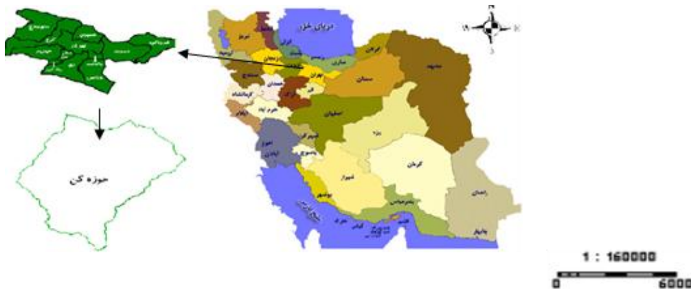
شکل ۱. موقعیت منطقه مورد مطالعه در ایران

حوزه آبخیز کن، در استان تهران، با مساحت ۱۹۷ کیلومتر مربع، در فاصله بین طول‌های جغرافیایی ۱۰