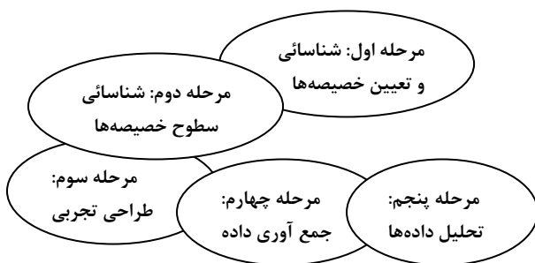
نمودار ۲. مراحل روش انتخاب تجربی ۱

Hanley, Mourato and Wright در سال ۲۰۰۱ بحث مفصلی از این روش را ارائه دادند. آنها مراحل این روش را به صورت نمودار ۲ در قالب ۵ مرحله بیان کردند [۱۴].